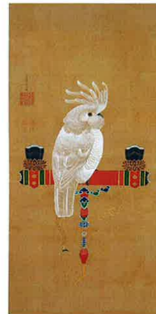
【観劇図】 伊藤若冲筆 江戸時代・18世紀後半(後期展示)