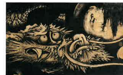
【鑑賞図】 (部分) 曾我蕭白筆 江戸時代・宝暦13年(1763) (前期・後期展示)

海外における日本美術コレクションとして、世界随一の規模と質の高さを誇るアメリカ・ボストン美術館。名古屋ボストン美術館では「ボストン美術館 日本美術の至宝」と題して、その収蔵品の中から仏画や絵巻、近世絵画まで66件を前・後期に分けて展示。修復後、世界初公開となる曾我蕭白作「雲龍図」をはじめ、日本美術の至宝が勢揃いする。前期6月23日~9月17日、後期9月29日~12月9日。問合せ先 ☎052-684-0101 🌐www.nagoya-boston.or.jp